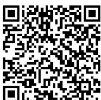
LD-SKAIP ステップ I