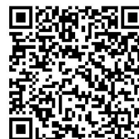
LD-SKAIP ステップ III